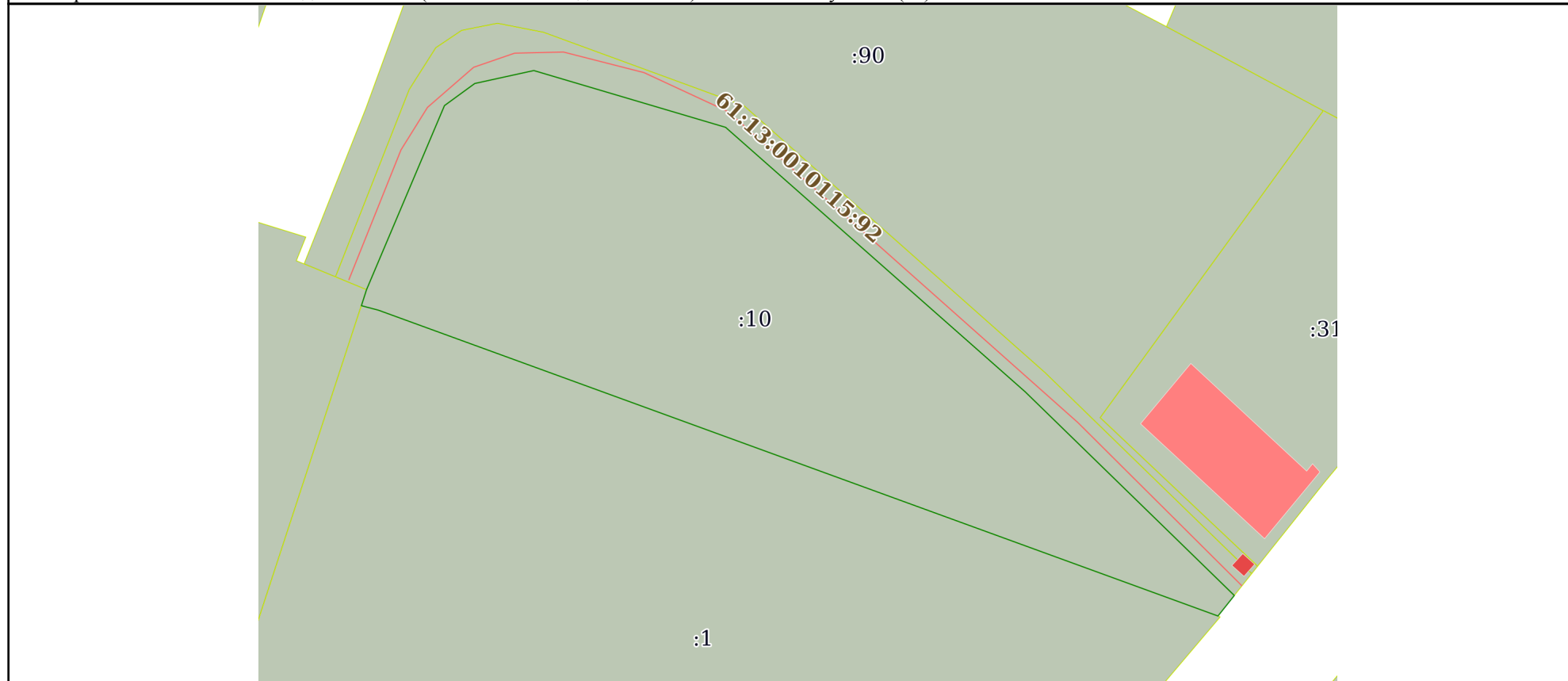
Схема расположения объекта недвижимости (части объекта недвижимости) на земельном участке(ах)